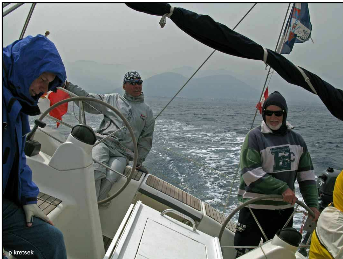
Bei Windstärke 5 – 6

Am Montag fast kein Wind, spiegelglattes Wasser und unter Motor nach Trapani, der großen Hafenstadt an der Westküste Siziliens. Nach schöner Fahrt vorbei am Monte Cofaro und am Monte Erice fuhren wir die gesamte Nordseite der barocken